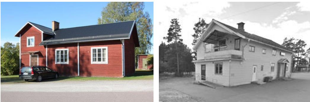
Figur 5. Till vänster; frälsningsarméhuset. Till höger; Lingheds bystuga.

Den busstation som tidigare planerades för Linghed 199:1 är inte längre aktuell. Fastigheten planläggs istället för bostadsändamål.