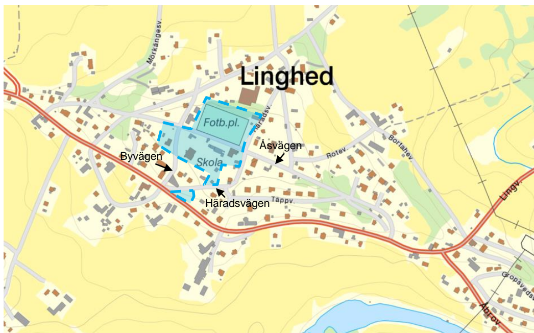
Figur 1. Planområdets läge i Linghed