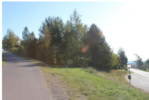
Figur 3. Till vänster; del av skolgården. Till höger; fastigheten Linghed 199:1 vid Åsgatan.

Planområdet längst i söder, Fastigheten Linghed 199:1 och Linghed 178:1, ligger i kilen mellan Lingvägen och Häradsvägen. Marken sluttar mot Lingvägen och är bevuxen med sly, löv- och barrträd.