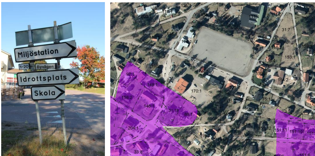
Figur 4. Till vänster; vägskyltar vid Lingvägen. Till höger; fornlämningsområdets utbredning.

Söder om före detta frälsningsarméhuset och skolfastigheten finns ett fornlämningsområde, Riksantikvarieämbetets bevakningsobjekt 206:4. Lämningsarna består av ett antal gårdstomter från medeltiden. Fornlämningar skyddas enligt Kulturmiljölagen och får inte skadas. Den som på något sätt vill ändra i ett område där det finns fasta fornlämningar måste ha tillstånd från länsstyrelsen.