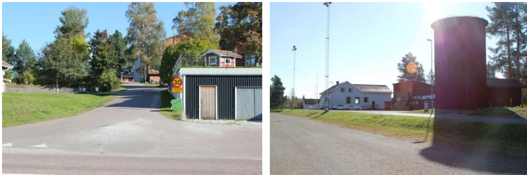
Figur 2. Till vänster; Byvägen upp från Lingvägen. Till höger; Åsvägen med vattentornet och bystugan i bakgrunden

Mellan idrottsplanen och skolan går Åsvägen. Åsvägen korsas av Byvägen som löper tvärs över Åsen från Lingvägen, förbi Skolan och till Ösängsvägen. Planområdets storlek är cirka 2,6 hektar.