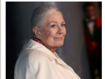
I dag fyller skådespelaren Vanessa Redgrave 86 år.

■ För 51 år sedan , 1972, föddes hoppryttaren Peder Fredricson . Han fick en silvermedalj vid OS 2016 och guld under EM i Göteborg 2017. Han har också ett lagsilver från OS, VM och EM. Fredricson har flera segrar i Grand Prix och vann Falsterbo Grand Prix 2019. Han är också verksam som grafisk formgivare och konstnär.