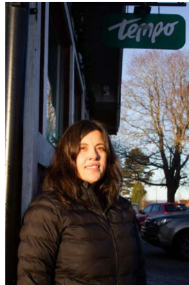
Sedan 20 år tillbaka drivs butiken av en ekonomisk förening.